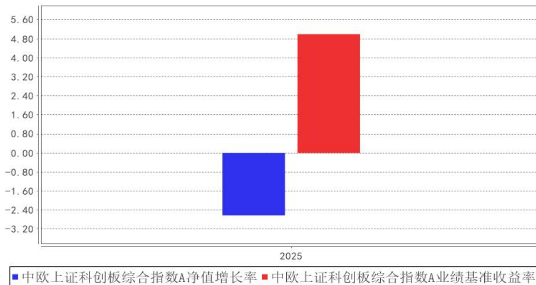
中欧上证科创板综合指数A基金每年净值增长率与同期业绩比较基准收益率的对比图

注：本基金合同生效日为 2025 年 9 月 9 日，2025 年度数据为 2025 年 9 月 9 日至 2025 年 12 月 31 日数据。