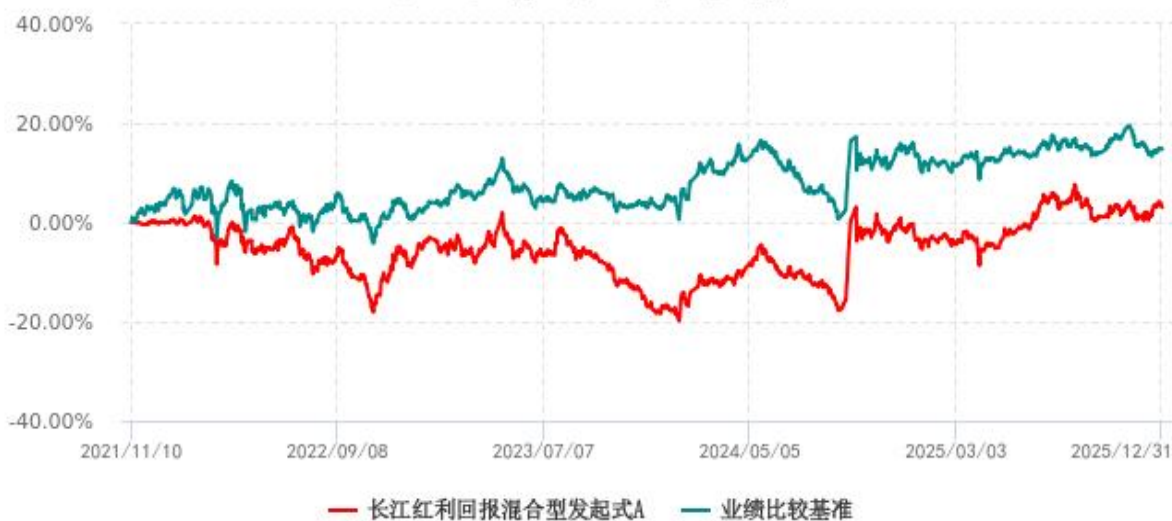
长江红利回报混合型发起式A累计净值增长率与业绩比较基准收益率历史走势对比图 (2021年11月10日-2025年12月31日)