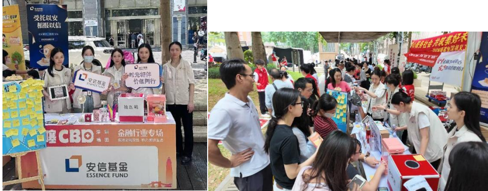
(安信基金线下金融科普活动)

2、安信基金特别注重对资本市场新政策、新制度、新业务的及时解读，相关原创产品达9种，有效帮助投资者理解市场改革，适应新规变化。同时，我们创作了2种引导投资者通过调解、诉讼等合法途径理性维权的产品，强化了投资者的权利意识和自我保护能力。