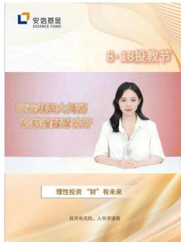
（安信基金创意投教短视频）

除了线上活动，安信基金也通过线下形式走进福田兴融社区公园，在福田“哇噻 CBD”企业特色展中，组织开展了一场“有温度的金融科普”活动。活动紧扣“保障金融权益，助力美好生活”主题，将理性投资知识、非法集资防范要点融入多元趣味互动，让专业金融真正“走进社区、贴近居民”。通过答题闯关、欢乐踢毽子、书写投教语录、观看投教视频等多样互动以趣促学，即使在炎炎夏日里，参与居民仍热情不减，大家借助熟悉的运动形式，消除对金融知识的“距离感”，在互动中强化知识记忆，不仅有效宣传了金融安全理念，还帮助居民深化了对非法集资风险的认知，进一步拓宽了投教工作的覆盖广度与影响深度，体现了安信基金对“多元化投教模式”的探索与实践，为维护金融权益、助力美好生活贡献安信力量。