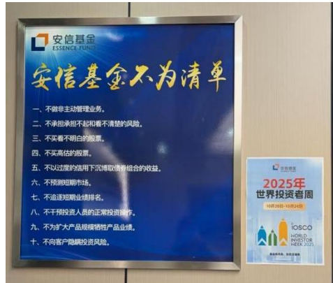
(办公场地进行海报宣传)