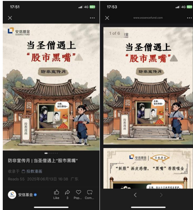
(安信基金原创漫画宣传：当圣僧遇上“股市黑嘴”)

此外，今年以来，安信基金积极探索 AI 赋能，创新运用数字人技术，录制创意投教短视频，使内容更具趣味性、亲和力与科技感，争取吸引更多年轻投资者群体。该数字人投教视频向投资者科普了非法集资的全流程，从“画饼”到“跑路”的完整陷阱，着重提醒投资者防范非法集资需记住两“不”口诀，不信“偏门”，不贪“小利”，投资理财需选择正规机构和渠道，警惕各类标榜“低风险、高回报”的投资理财项目，切勿受“高收益”诱惑而冲动投资。该数字人投教视频发布于我司“安信伴你行”视频号，阅读量超 3000 次，点赞转发量超 100 次，努力实现投教内容的“破圈”传播。