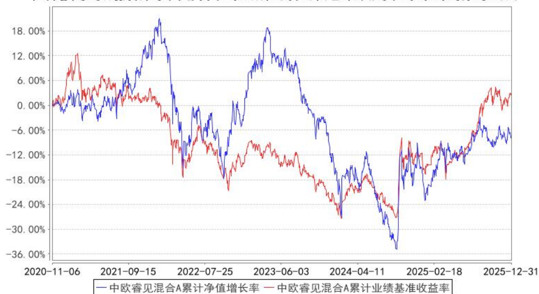
中欧睿见混合A累计净值增长率与同期业绩比较基准收益率的历史走势对比图