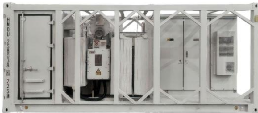
新能源风电/光伏专用箱变