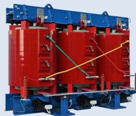
陆上风电用机舱干式变压器

一款专为陆上风力发电系统设计的机舱内置式干式变压器。它安装于风力发电机组的机舱内，核心功能是将风力发电机发出的电能升高至更高的电压等级，以便通过集电线路高效地传输至风电场升压站。产品采用环氧树脂浇注的干式设计，具有高可靠性、免维护、防火防爆、环保等突出优点，完美适应陆上风电机组内部空间紧凑、振动频繁的工况，是实现风电机组高效、安全发电的关键电气设备。