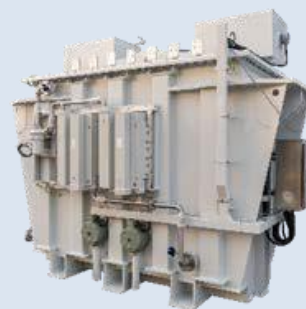
海上机舱液浸式变压器

专为海上风力发电设计的一种电力变压器，可以被直接安装在风力发电机的机舱内部。在海上风电系统中，发电机在机舱内产生的中压电能，需要通过升压变压器将电压升高，以减少在长距离海底电缆传输过程中的能量损耗。为了节省空间、优化系统结构，将这种升压变压器从传统的箱式变电站形式，创新性地集成到了风电机组的机舱内。目前产品已完成样机制作。