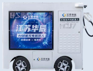
HCU7 自动驾驶式储充机器人

具备自动驾驶功能的分布式、模块化储能充电设备，实现“桩位分离”，服务思路从“车找电”转变为“电找车”，解除充电桩与充电车位绑定的关系，为各充电场所提供无人驾驶的移动储能快充解决方案。目前产品已完成样机制作。