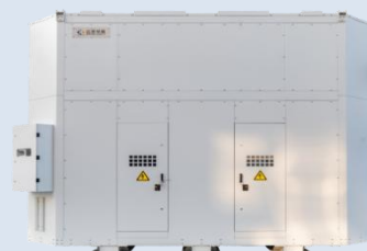
海上风电用机舱干式变压器

一款专为海上风力发电系统设计的机舱内置式干式变压器。它安装于海上风力发电机组的机舱内，核心功能是将风力发电机发出的电能（较低电压，如 1.14kV）升高至更高的电压等级（如 69kV），以便通过海底电缆高效地传输至海上升压站或陆上电网。该产品冷却方式采用风冷水冷式，外壳采用全封闭式(IP54)，能有效隔离海上潮湿空气，并且采用水冷降温，大幅降低产品温升，减小产品体积，保证产品可靠运行。产品线圈采用环氧树脂浇注的干式设计，具有高可靠性、免维护、防火防爆、环保无毒等突出优点，完美适应海上风电平台空间紧凑、环境恶劣、运维困难的特殊要求。