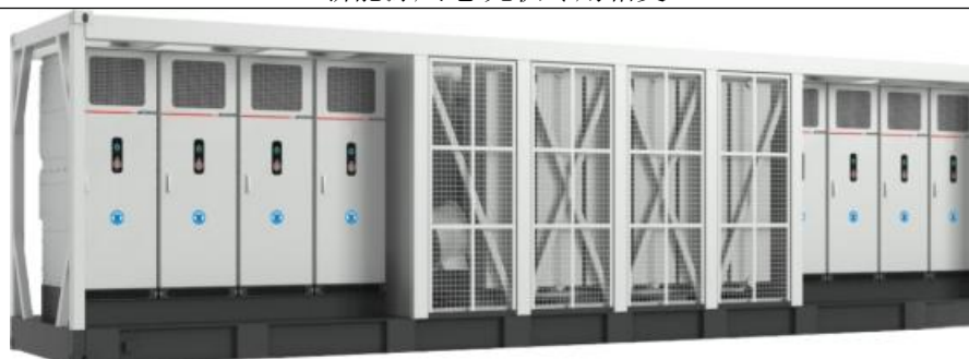
储能专用华式一体机

公司依托深厚电力储能技术积淀，研发移动储能车、储能一体柜、中压交直流一体储等系列储能装备。产品高度集成、布局紧凑、适配性强，全面覆盖户用储能、工商业储能、线路末端质量治理、大型储能电站等多元应用场景。可广泛适配公共充电站、工商业能源站、配电网末端台区、偏远无电园区及孤岛厂区等复杂工况，兼具高效运维与灵活部署优势，为多场景绿色储能应用提供一体化可靠解决方案。