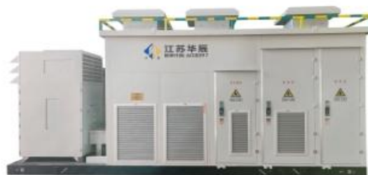
储能一体机(集中式)