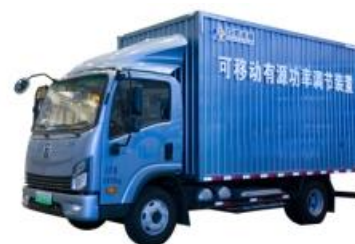
可移动有源功率调节装置