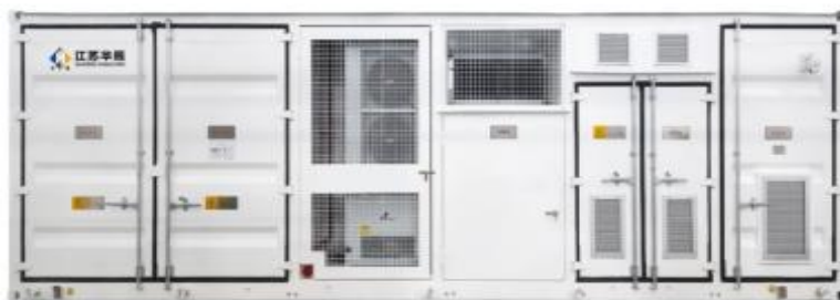
中压交直流一体储能舱