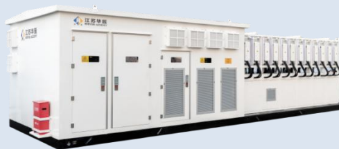
储能变流升压一体机（组串式）

组串式 5MW 跟网型变流升压一体化系统，由江苏华辰自行研发，可灵活应用于 2.5MW 构网工况，是电网接口的核心设备，专注于“直流变流 - 交流升压”全链路能量转换。该系统集成华辰定制化高低压设备、变压器及华为智能组串式 PCS，专为新能源储能电站并网、分布式能源消纳、电网辅助服务等应用场景设计。系统以“高转换效率、高并网稳定性、高集成适配性”为核心优势，有效支撑直流电能高效接入交流电网，满足电网对储能电站的调度与管控需求。