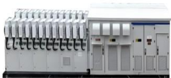
储能一体机(组串式)