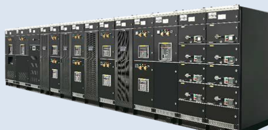
HCM power2500 2.0

预制式供配电模组，集成中低压配电系统、变压器、UPS 和 ATU 智能管理系统为一体，简化供配电系统架构。产品内部采用全铜排连接，并在厂内完成集成，具备统一管理、高可靠性、节省占地、经济美观等特点，同时能实现工程产品化，设备与现场解耦，从而实现数据中心的快速部署以及智能化监控管理，是用户理想和完善的电源解决方案，目前产品已完成样机制作。