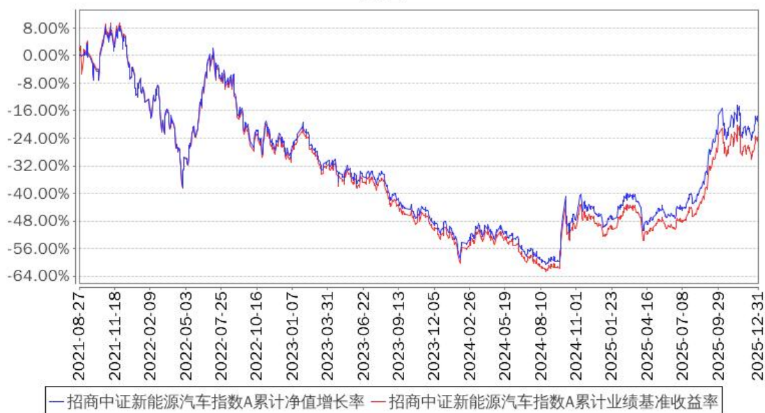
招商中证新能源汽车指数A累计净值增长率与同期业绩比较基准收益率的历史走势对比图