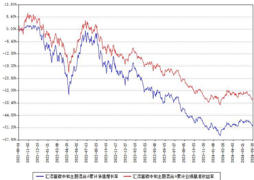
汇添富碳中和主题混合A累计净值增长率与同期业绩基准收益率对比图