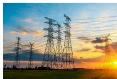
国网山东省电力公司 2024 年第一次配网物资协议库存招标采购标准化低压柜项目