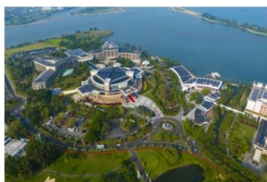
重庆市潼南区产教融合示范片区开发项目

建筑行业： 公司聚焦房地产头部央企及重点区域有影响力的工商建客户，与中海、保利、华润、中铁建、越秀、金茂等达成深度战略合作，持续中标中海发展多个战略集采购项目，均为独家品牌。公司积极响应国家“绿色建筑”“双碳”政策，在电能管理、配电运维、安全用电等领域提供完善的智慧系统解决方案，为客户提供高品质产品与服务。