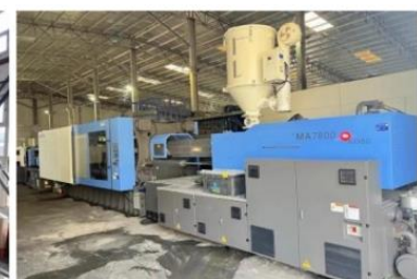
海天塑机集团有限公司

分销业务： 公司持续推进经销商赋能和数字化建设，65% 的核心经销商实现与公司的信息互通。2024 年，公司新增价值终端 820 余家，实施经销商分层分级评定，优化资源配置，精准投入，促进核心经销商综合能力提升，推动渠道共创共享共赢发展，构建更优质的合作伙伴生态。