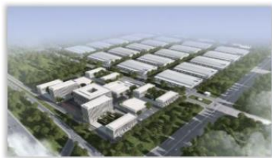
中国移动通信集团广东有限公司 2024 年低压成套开关设备公开招标采购项目