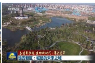
雄安新区容西片区输变电配电箱项目