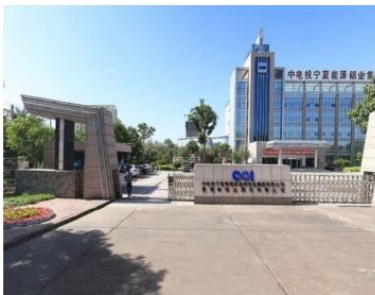
国家电投宁夏能源铝业科技工程有限公司 630kVA 箱变项目