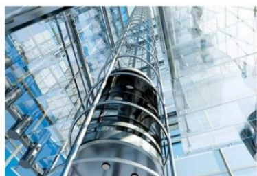
奥的斯电梯照明控制箱项目

OEM 设备行业： 2024 年，公司新增 OEM 设备行业业务线，聚焦国内主流行业头部客户开发及工业企业设备配套，涵盖电梯、水泵、纺机、风机、塑机等民生与经济发展支柱行业。公司针对 TOP20 客户展开定向研发，扩展电气产品应用，通过联合创新研究提升行业新质生产力，提高设备运行效率、安全性和稳定性。经过公司的持续投入和行业线团队半年的努力，公司已为凯泉泵业、东方泵业、奥的斯电梯、海天塑机、日发纺织等客户提供针对性解决方案和产品，实现业务线超 20% 的增长。