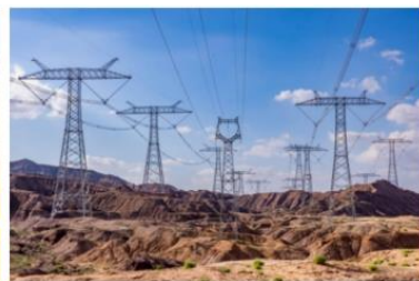
国网甘肃省电力公司 2024 年第一次配网物资协议库存公开招标采购项目

通讯行业： 公司在重庆移动 2023-2025 年 UPS 输入输出屏项目、山东移动 2024-2026 年变压器及箱式变电站采购项目、中国移动呼和浩特数据中心 B09 机楼、中国移动粤港澳(韶关)数据中心等超大型数据中心供配电及电源配套项目中达成合作。天正品牌首次入围运营商集团公司层面，断路器品牌成功入围中国联通集团集采（2024 年中国联通 48V 组合式开关电源设备集中采购项目、2024 年中国联通 240V 直流供电系统集中采购项目），并取得较大配套中标份额。作为通讯行业及数据中心的上游优质供应商，公司直流熔断器已供货于腾讯、百度等客户的高压直流系统电源产品。此外，公司高端智能化产品和数智化解决方案先后助力成都天府国际机场、上海浦东国际机场、粤港澳“深中通道”等国家重大工程的“通信覆盖”建设，并为西安地铁、杭州地铁等民用通信项目提供高质量配电保障。