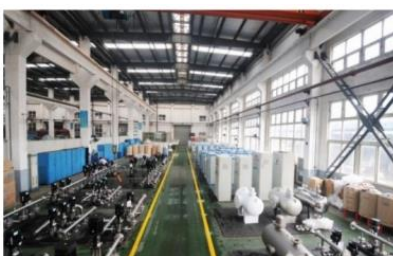
上海凯泉泵业集团有限公司