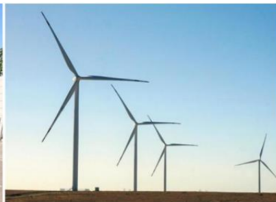
神木中能建巨皇新能源佳县 150 兆瓦风电项目

电力行业： 公司持续在国家电网、南方电网中标，并在四川、黑龙江、浙江、河北、江苏、山西等省电力公司保持业务增长，同时在辽宁、吉林等省份实现突破。公司智能化产品如量测开关、光伏开关在多省供货，紧跟电网智能化、平台化、数智化趋势，深耕工业物联网领域，持续提升智能制造水平及平台与软件系统集成能力。