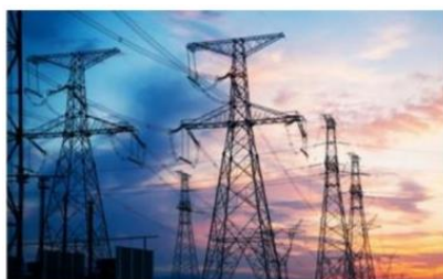
南方电网公司 2024 年配网设备第一批框架招标项目

电力行业： 公司持续在国家电网、南方电网中标，并在四川、黑龙江、浙江、河北、江苏、山西等省电力公司保持业务增长，同时在辽宁、吉林等省份实现突破。公司智能化产品如量测开关、光伏开关在多省供货，紧跟电网智能化、平台化、数智化趋势，深耕工业物联网领域，持续提升智能制造水平及平台与软件系统集成能力。