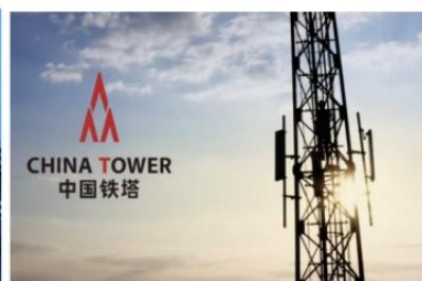
安徽铁塔 2024 年精准直流配电设备增补采购项目

建筑行业： 公司聚焦房地产头部央企及重点区域有影响力的工商建客户，与中海、保利、华润、中铁建、越秀、金茂等达成深度战略合作，持续中标中海发展多个战略集采购项目，均为独家品牌。公司积极响应国家“绿色建筑”“双碳”政策，在电能管理、配电运维、安全用电等领域提供完善的智慧系统解决方案，为客户提供高品质产品与服务。