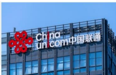
2024 年中国联通 48V 组合式开关电源集中采购项目