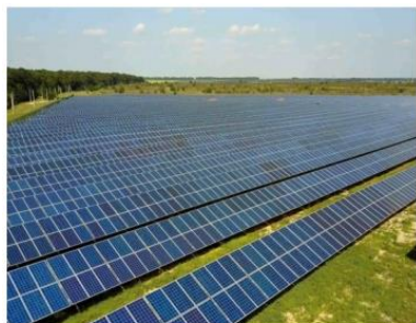
大唐广西林圩新华农光互补发电项目

降碳战略；持续支持新能源中游、下游企业客户需求，深化技术融合与产品联合开发。此外，公司深度参与储能逆变器头部厂商的定制研发，推动产业模块化、小型化、高效化发展。