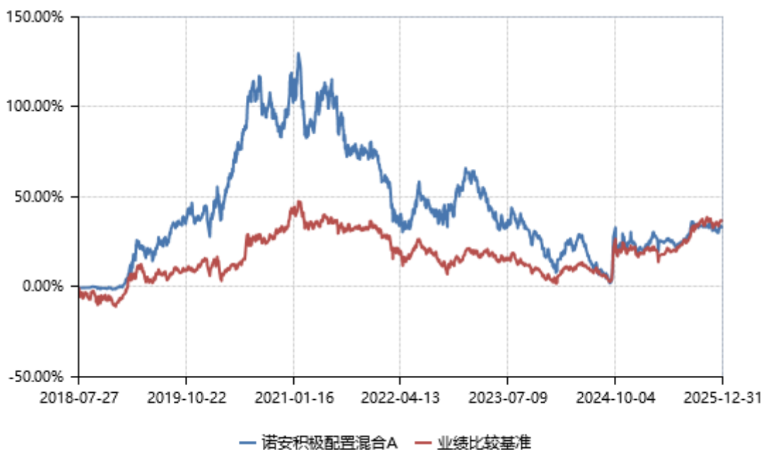
诺安积极配置混合 C