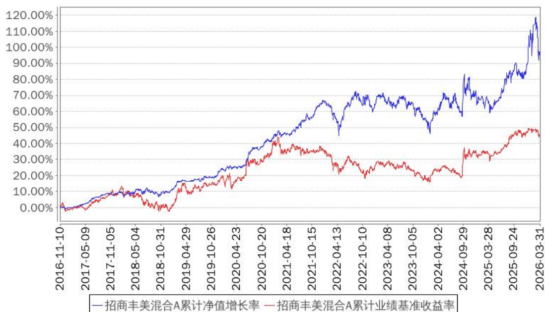
招商丰美混合A累计净值增长率与同期业绩比较基准收益率的历史走势对比图