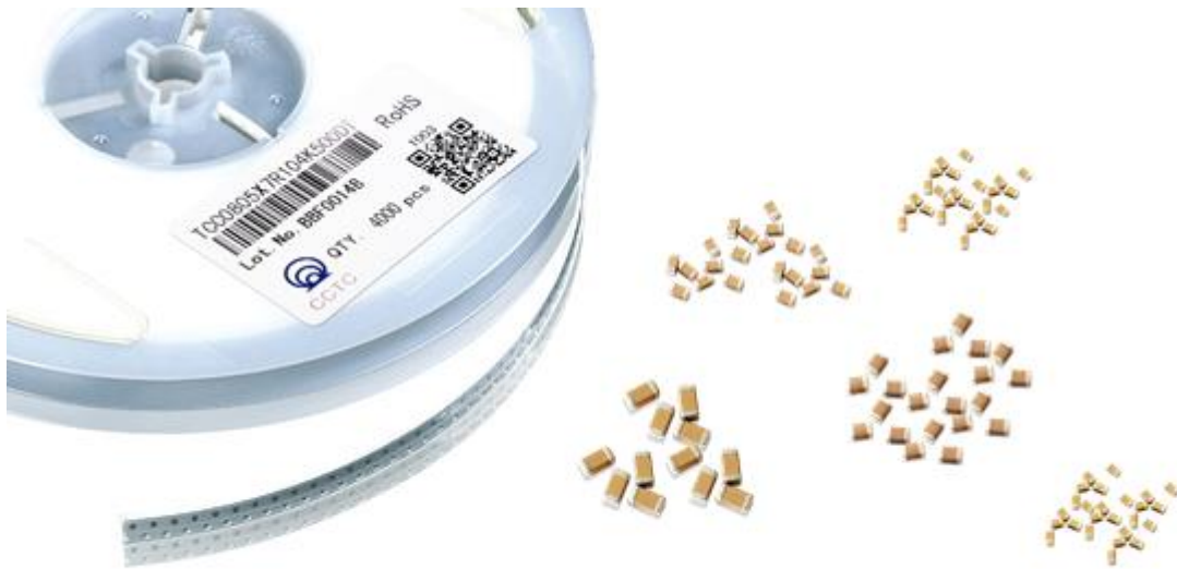
图为多层陶瓷片式电容器（MLCC），源自公司网站

随着片式电容应用领域的拓宽以及国外产能的逐步转移，MLCC产品需求强劲。公司把握时机，积极推进新规格产品研发以及提升原有产品质量，凭借自身技术优势和品牌效应，进一步引入新客户，扩大销售规模，目前公司的MLCC产品已广泛应用于家电、照明、消费电子、工业控制、通信设备、汽车电子等领域。报告期内，该产品为公司利润的增长做出了较大贡献。