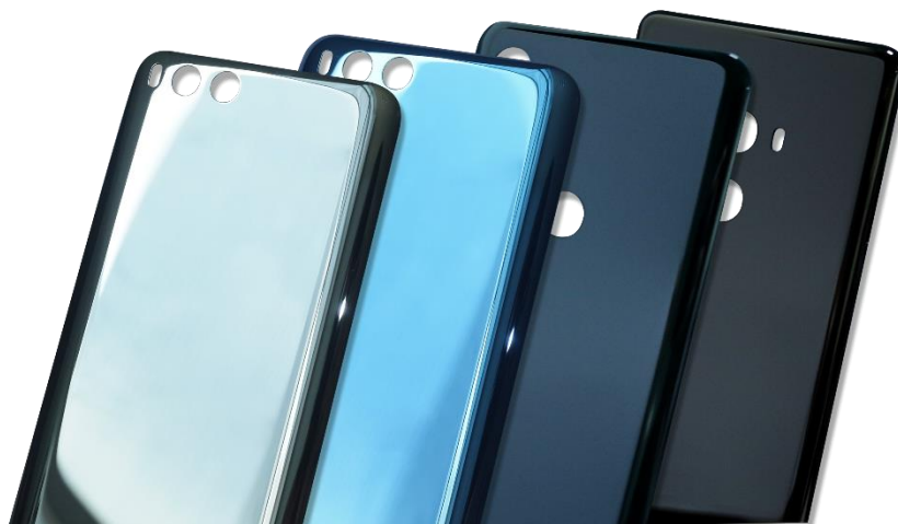
图为手机陶瓷后盖

联网，再到云服务行业，5G的建设拉动产业链的需求增长。受益于5G建设，光通信市场持续保持平稳增长，公司相关产品销售规模继续得以提升。报告期内，公司不断提升手机陶瓷后盖产品的工艺技术，并召开了“三环火凤凰2.0发布会”，推出了主打新颜色、新工艺、新效果的迭代升级版“三环火凤凰2.0”陶瓷材料，在同等结构下，“火凤凰2.0”陶瓷的重量比以前可减轻30%左右，在工艺效果及颜色方面都取得了新的突破，为客户提供更多样化的产品设计方案。