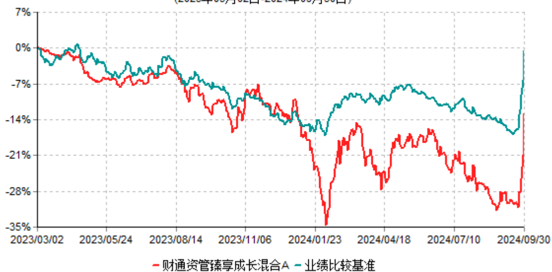
财通资管臻享成长混合A累计净值增长率与业绩比较基准收益率历史走势对比图 (2023年03月02日-2024年09月30日)