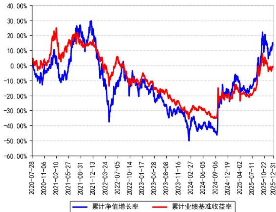
南方科创板3年定开混合累计净值增长率与同期业绩比较基准收益率的历史走势对比图