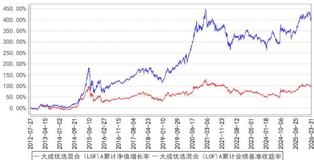
大成优选混合（LOF）A累计净值增长率与同期业绩比较基准收益率的历史走势对比图