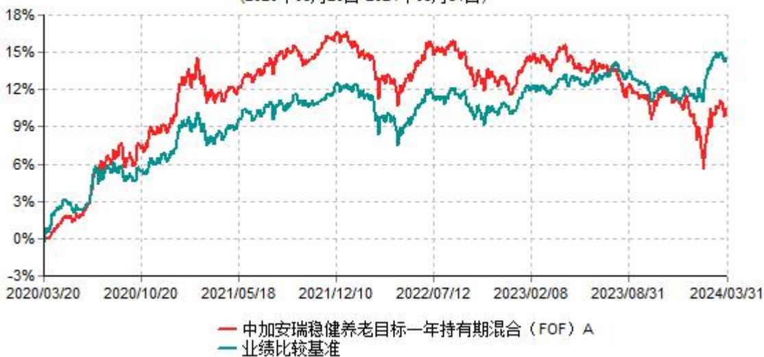
中加安瑞稳健养老目标一年持有期混合（FOF）A累计净值增长率与业绩比较基准收益率历史走势对比图 (2020年03月20日-2024年03月31日)