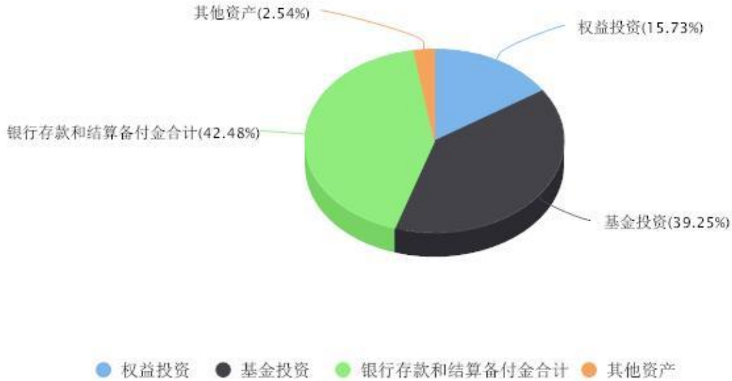
投资组合资产配置图表 数据截止日期:2023年06月30日