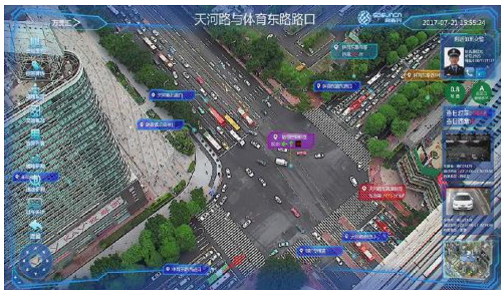
交通监控云行系统