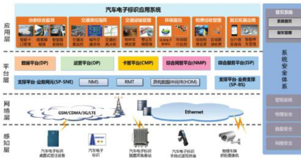
汽车电子标识系统示意图

公司拥有汽车电子标识系列全套技术和产品，可以提供从采集层到平台和应用层的整体智能交通管理解决方案，包括感知层设备（包括陶瓷标签、条卡标签、室内外阅读器、一体式阅读器、手持式阅读器等）、平台层软件（设备远程管理平台、智能交通数据平台、卡管平台等）以及应用层软件（假套牌稽查系统、交通流量监控系统等）。