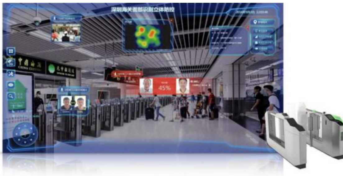
深圳海关面部识别立体防控系统