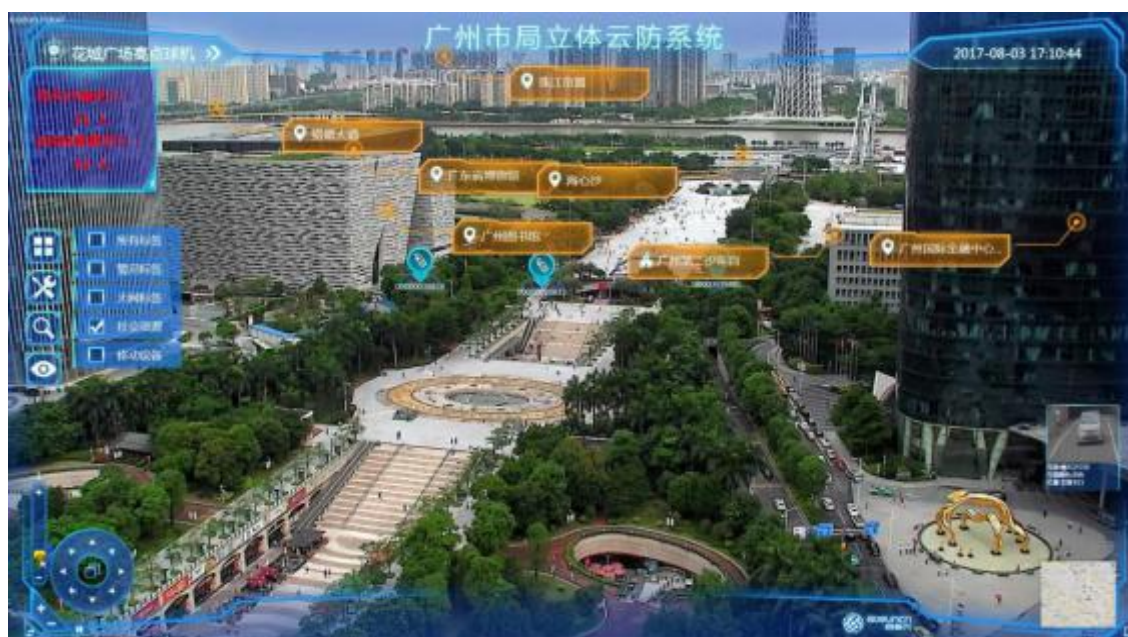
广州花城汇立体云防系统