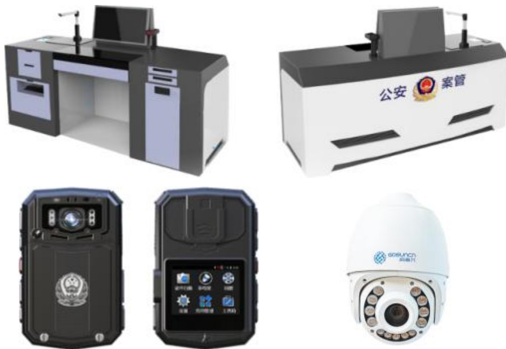
其他物联终端产品

警务终端方面，公司持续加大执法视音频记录仪的研发，丰富执法视音频记录仪产品序列，满足客户不同需求，助力提高执法记录仪终端市场占有率。公司新推案管中心一体机系列产品，是集案件管理、智能分析于一体的智能软硬件一体化平台，通过智能算法对办案场所的视频录像进行分析，智能分析有效的保证整个案件录像的完整性，使得整个案件处理过程更加高效、智能。 报告期内，案管系列产品成功进入深圳市场，打造经典标杆项目。