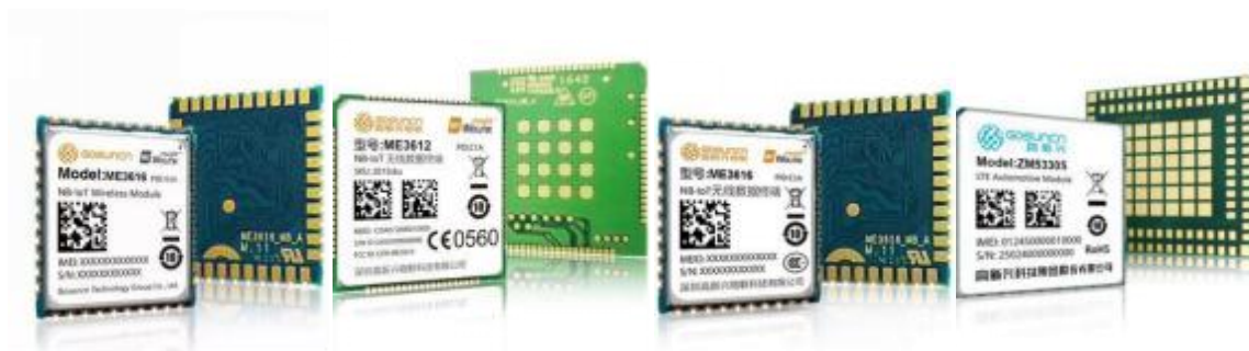
NB-IoT 模组及车规级模组产品

此外，公司紧跟通信运营商NB-IoT网络推广的业务需求，自主研发NB-IoT烟雾传感器、NB-IoT温湿度传感器、NB-IoT DTU、NB-IoT采集器、NB-IoT单路开关量传感器、NB-IoT单相智能电表、NB-IoT三相智能电表等产品。