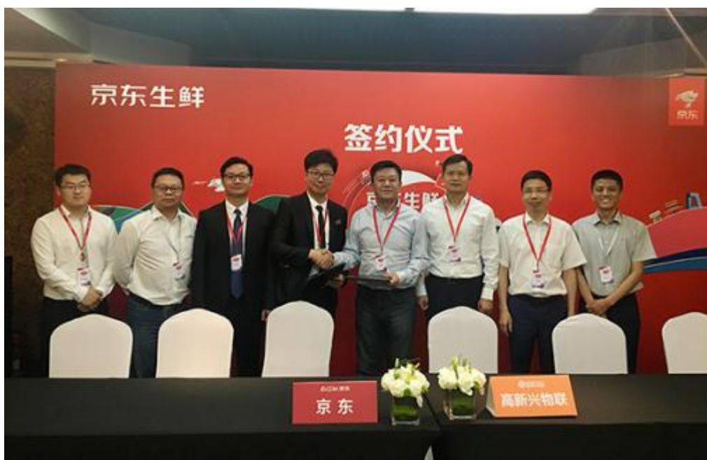
公司与京东生鲜签订合作协议现场