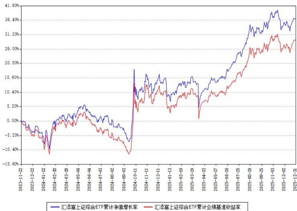
汇添富上证综合ETF累计净值增长率与同期业绩基准收益率对比图

注：本基金建仓期为本《基金合同》生效之日（2023年11月22日）起6个月，建仓期结束时各项资产配置比例符合合同约定。