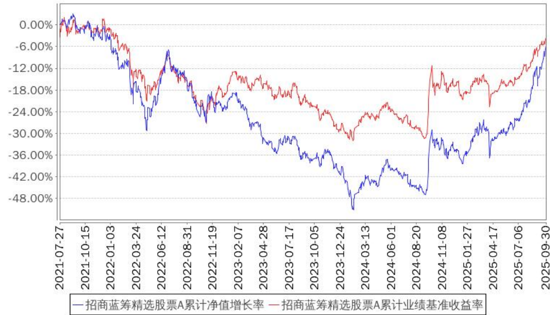
招商蓝筹精选股票A累计净值增长率与同期业绩比较基准收益率的历史走势对比图