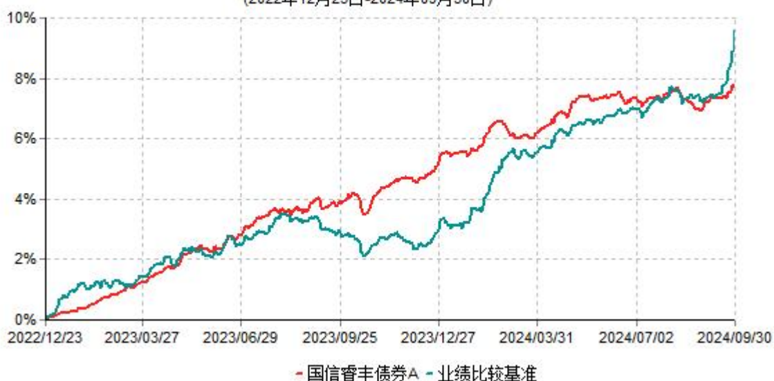
国信睿丰债券A累计净值增长率与业绩比较基准收益率历史走势对比图 (2022年12月23日-2024年09月30日)