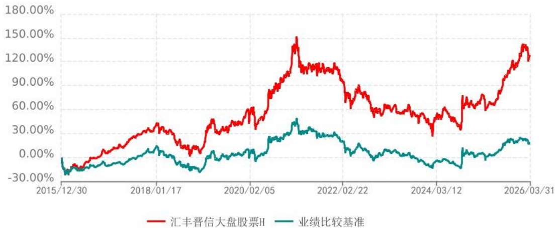
汇丰晋信大盘股票H累计净值增长率与业绩比较基准收益率历史走势对比图 (2015年12月30日-2026年03月31日)

注：1. 按照基金合同的约定，本基金的股票投资比例范围为基金资产的 85%-95%，其中，本基金将不低于 80%的股票资产投资于国内 A 股市场上具有盈利持续稳定增长、价值低估、且在各行业中具有领先地位的大盘蓝筹股票。本基金固定收益类证券和现金投资比例范围为基金资产的 5%-15%，其中现金（不包括结算备付金、存出保证金、应收申购款等）或到期日在一年以内的政府债券的投资比例不低于基金资产净值的 5%。