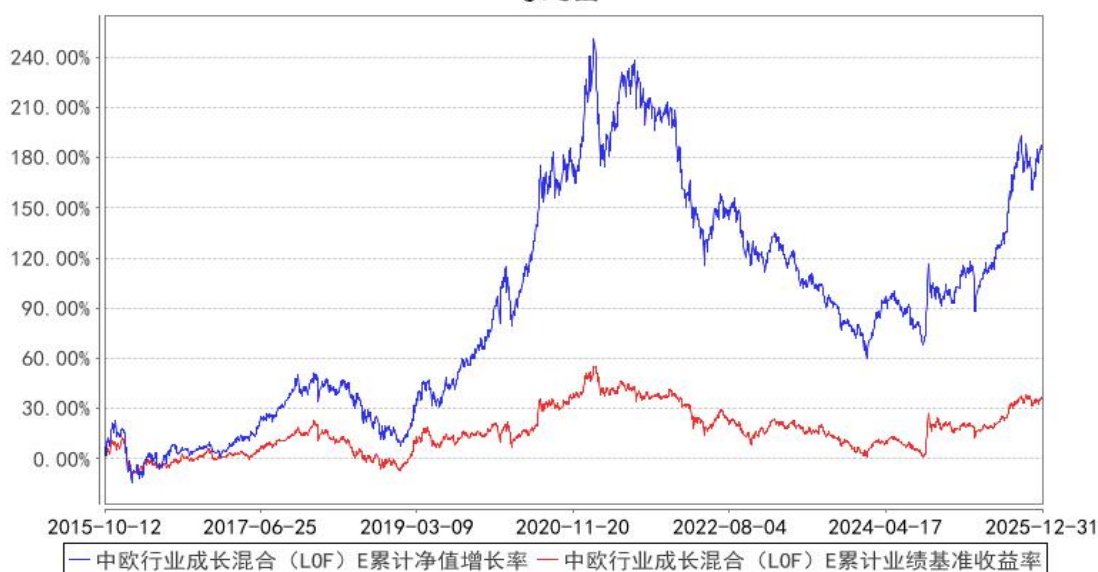
中欧行业成长混合 (LOF) E 累计净值增长率与同期业绩比较基准收益率的历史走势对比图

注：本基金自 2015 年 10 月 8 日新增 E 类份额，图示日期为 2015 年 10 月 12 日至 2025 年 12 月 31 日。