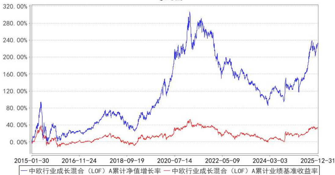
中欧行业成长混合 (LOF) A 累计净值增长率与同期业绩比较基准收益率的历史走势对比图