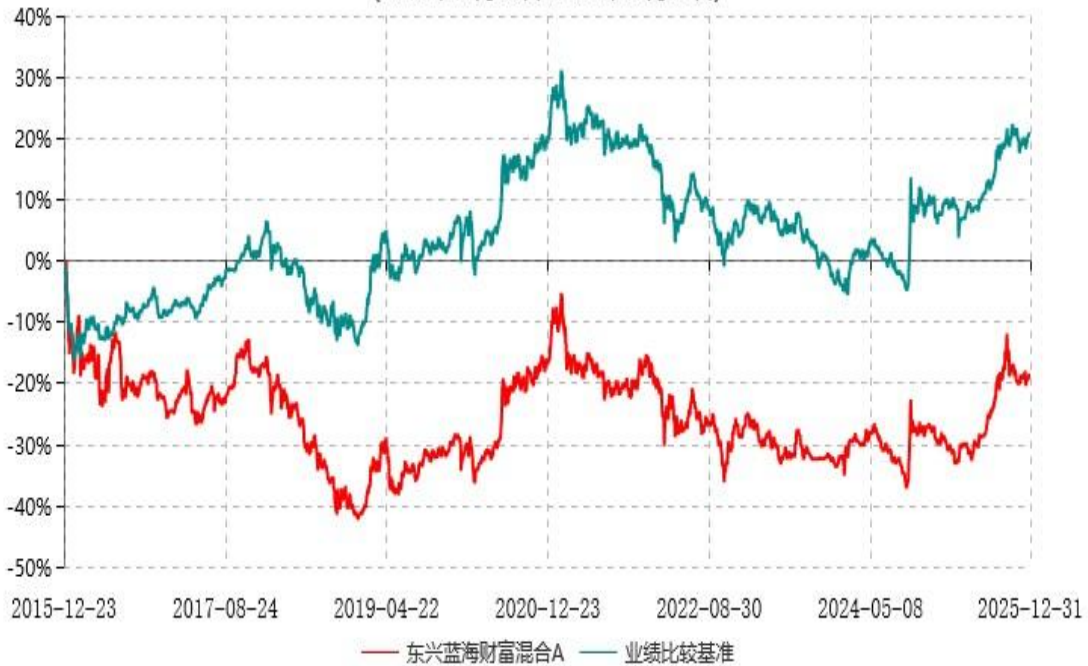
东兴蓝海财富混合A累计净值增长率与业绩比较基准收益率历史走势对比图 (2015年12月23日-2025年12月31日)