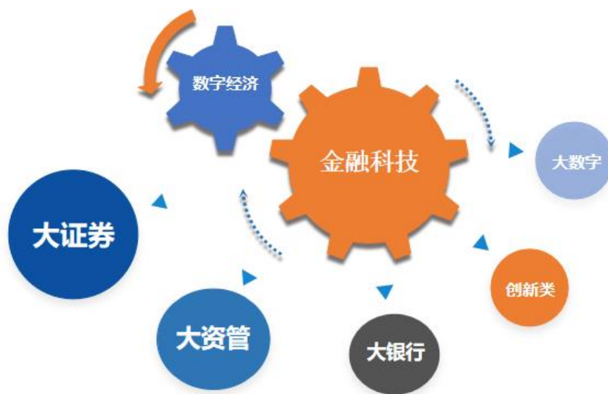
图：公司战略金融科技+数字经济双循环

公司通过主动投标、参与竞价的招投标方式，以及客户询价、公司报价的商务谈判方式获取业务，将公司相关产品和服务直接销售给目标客户并实施交付，同时向客户提供运营、数据、咨询及个性化定制服务。