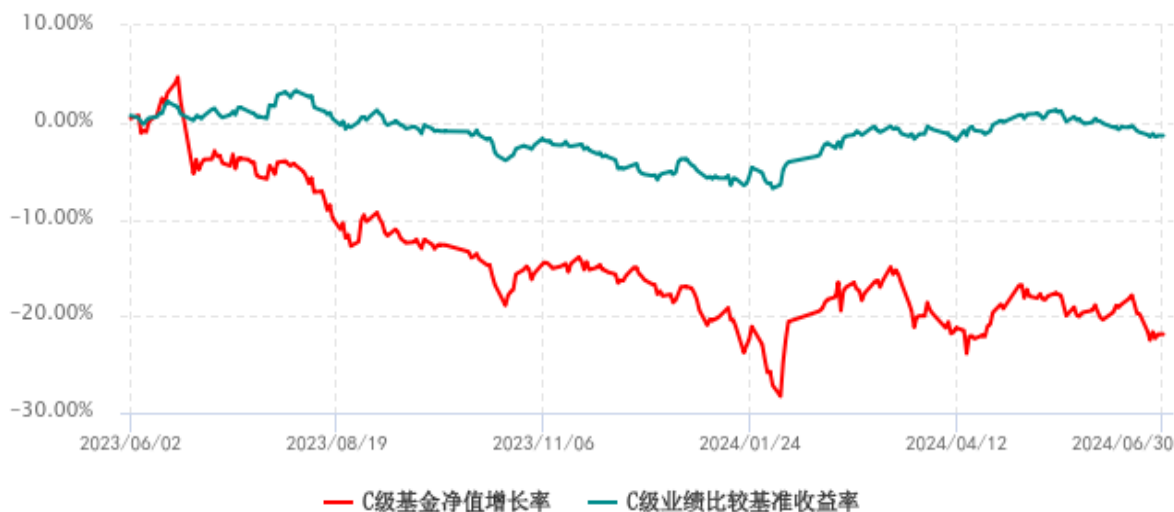
C级基金份额累计净值增长率与同期业绩比较基准收益率历史走势对比图 (2023年06月02日-2024年06月30日)