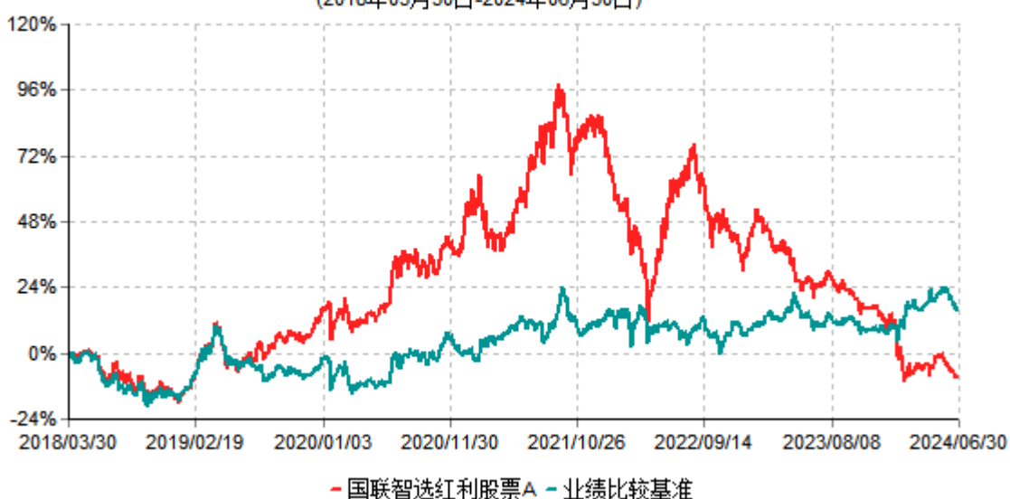
国联智选红利股票A累计净值增长率与业绩比较基准收益率历史走势对比图 (2018年03月30日-2024年06月30日)