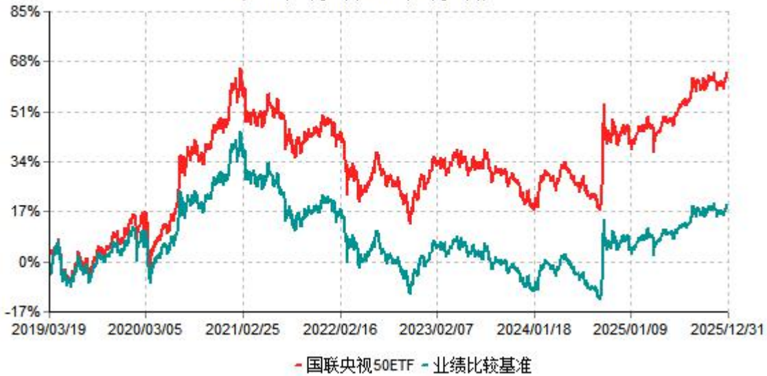
国联央视50ETF累计净值增长率与业绩比较基准收益率历史走势对比图 (2019年03月19日-2025年12月31日)

注：按基金合同和招募说明书的约定，本基金自基金合同生效日起6个月内为建仓期，建仓期结束时本基金的各项投资比例符合基金合同的有关约定。