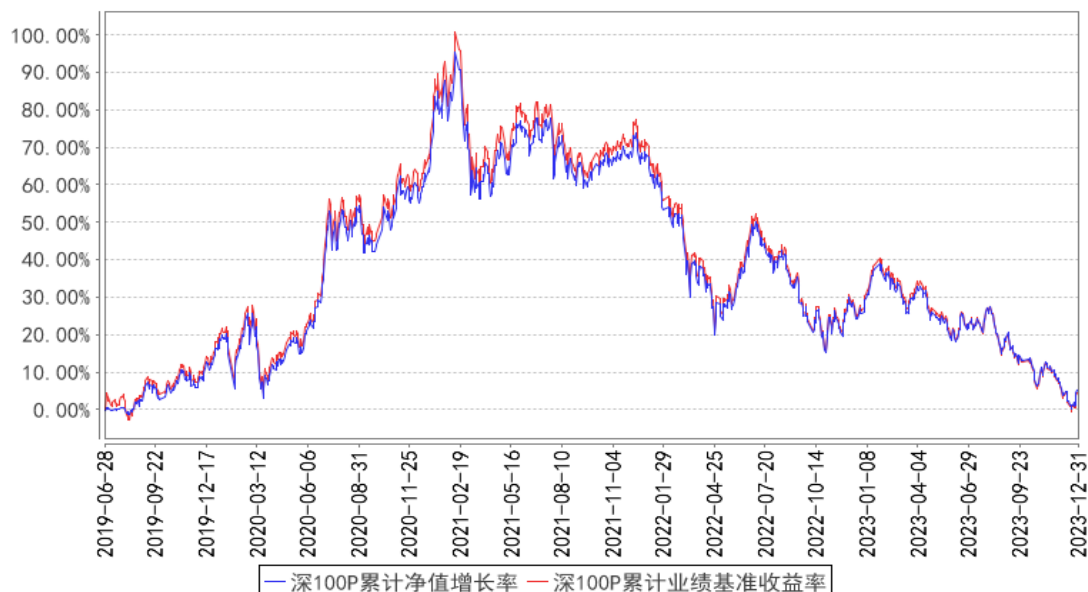
深100P累计净值增长率与同期业绩比较基准收益率的历史走势对比图

注：按基金合同的规定，本基金自基金合同生效起六个月为建仓期，建仓期结束时本基金的各项资产配置比例已达到基金合同的规定：本基金投资于标的指数成份股及备选成份股的资产比例不低于基金资产净值的 90%，且不低于非现金基金财产的 80%，因法律法规的规定而受限制的情形除外。