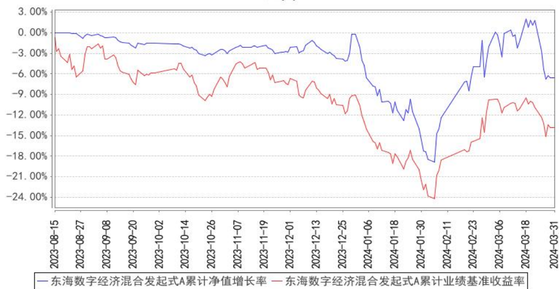
东海数字经济混合发起式A累计净值增长率与同期业绩比较基准收益率的历史走势对比图