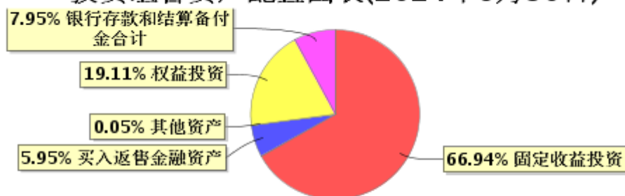
投资组合资产配置图表(2024年6月30日)

● 固定收益投资 ● 买入返售金融资产 ● 其他资产 ● 权益投资 ● 银行存款和结算备付金合计