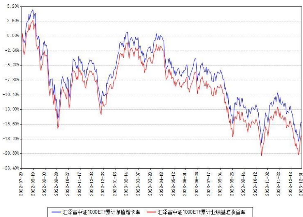
汇添富中证1000ETF累计净值增长率与同期业绩基准收益率对比图

注：本基金建仓期为本《基金合同》生效之日（2022年07月29日）起6个月，建仓期结束时各项资产配置比例符合合同约定。