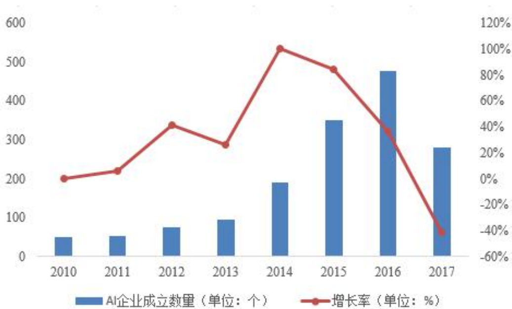
图表 5.27 我国人工智能企业数量情况

从企业数量来看，我国人工智能企业 2013 年之后呈现爆发式增长，并在 2016 年达到了近年来的高点，企业数量的增多使得行业竞争逐步加剧，2017 年以来市场投资更为理性，企业数量略有下降。