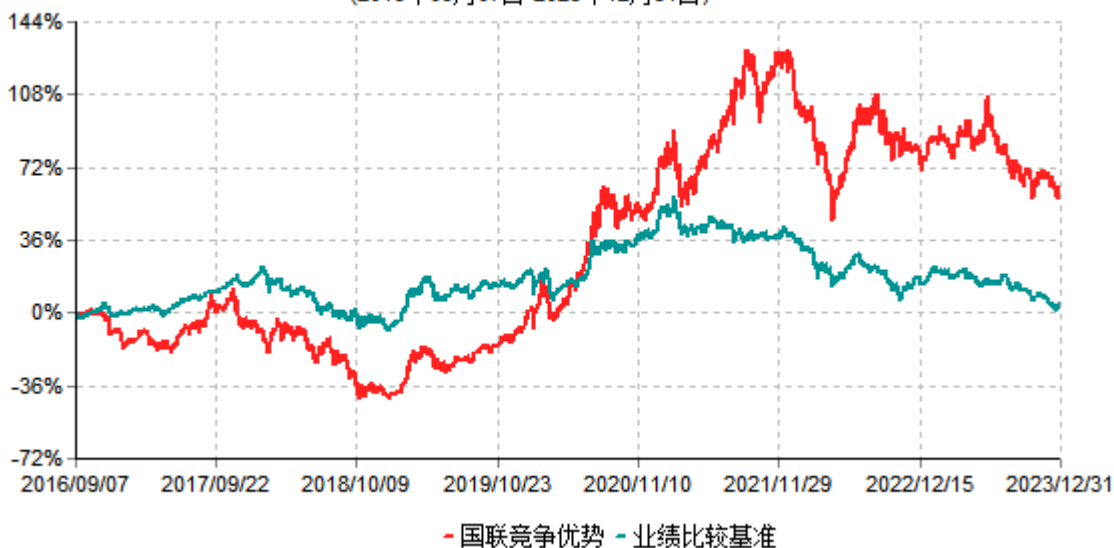
国联竞争优势股票型证券投资基金累计净值增长率与业绩比较基准收益率历史走势对比图 (2016年09月07日-2023年12月31日)

注：按基金合同和招募说明书的约定，本基金自基金合同生效日起6个月内为建仓期，建仓期结束时本基金的各项投资比例符合基金合同的有关约定。