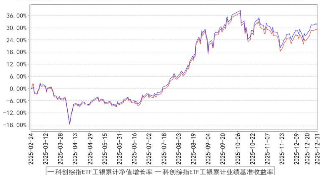
科创综指ETF工银累计净值增长率与同期业绩比较基准收益率的历史走势对比图

注：1、本基金基金合同于 2025 年 2 月 24 日生效。截至报告期末，本基金基金合同生效未满 1 年。