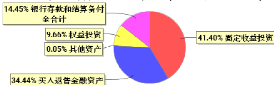
投资组合资产配置图表(2024年9月30日)

● 固定收益投资 ● 买入返售金融资产 ● 其他资产 ● 权益投资 ● 银行存款和结算备付金合计