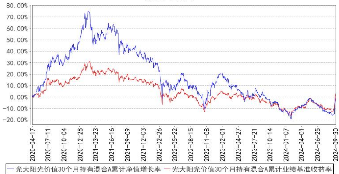
光大阳光价值30个月持有混合A累计净值增长率与同期业绩比较基准收益率的历史走势对比图