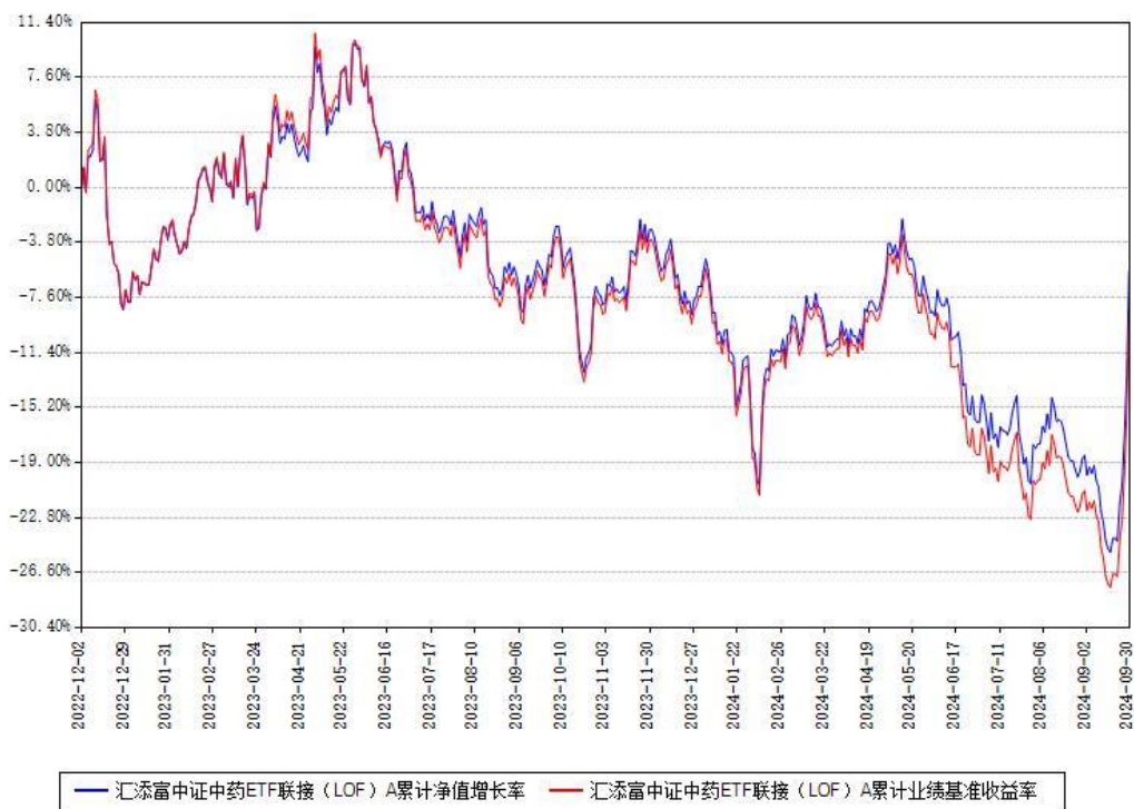
汇添富中证中药ETF联接（LOF）A累计净值增长率与同期业绩基准收益率对比图

(二)自基金合同生效以来基金累计净值增长率变动及其与同期业绩比较基准收益率变动的比较图