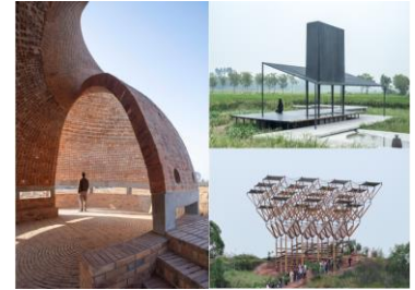
龙游·灏石光·艺术生态走廊