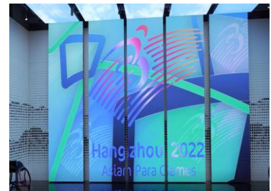
杭州亚运会 数字媒体内容服务