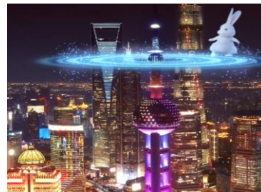
东方明珠 2023 跨年 AR 秀