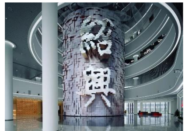
绍兴市城市展示馆