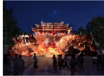
寿县古城墙区域文旅夜游提升