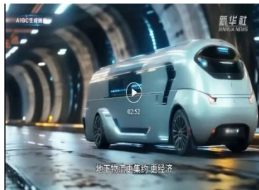
新华社 AIGC 绘中国

主要通过全息影像、裸眼 3D、CGI 特效等技术手段，AR/VR/MR、4K/8K 超高清视频等媒介形式，为客户和消费者提供商业展览、数字艺术消费品及各类数字视觉服务。代表作品：