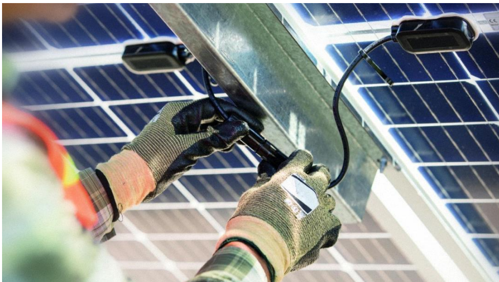
图 3-13 新能源连接器应用于光伏

新能源连接器是光伏、风能等新能源发电装置内部设备相互连接的关键零件，包括光伏面板、电池组件、汇流箱和逆变器等均需用到连接器，且此类装置对连接器的安全性要求较高。同时户外条件下动物撞击、天气影响等不确定因素也对新能源系统抗干扰能力形成挑战。故新能源连接器在有效处理电信号的同时，往往还需兼顾抗腐蚀、防漏电和面对户外复杂多变的气候环境等特点。