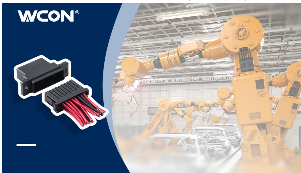
图 3-10 工业连接器应用于工业机器人