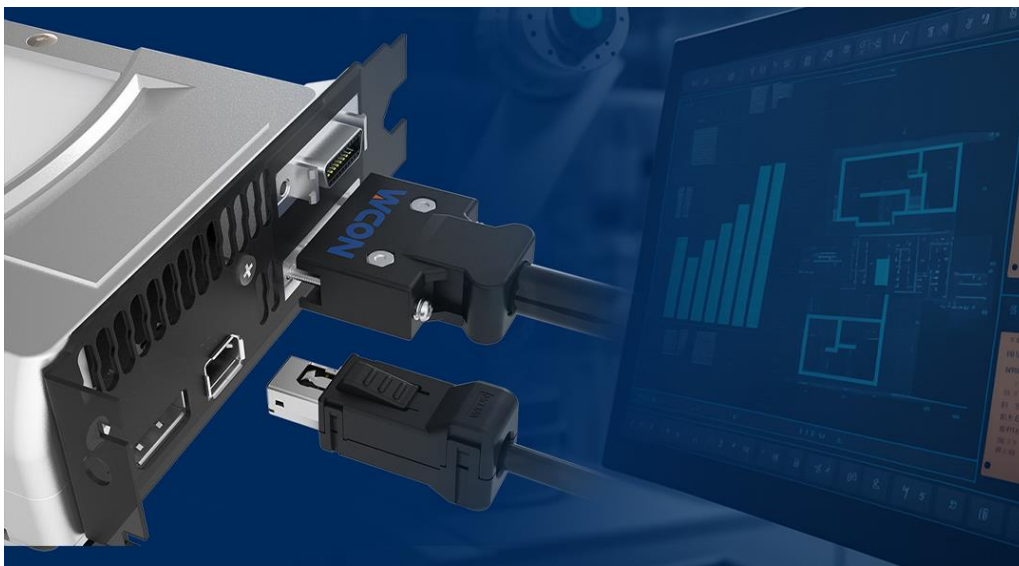
图 3-9 工业连接器应用于 PLC

工业控制系统中包含大量电气元件及设备，从 PCB 线路板、传感器，到驱动器、电机，再到工业电脑、电气柜等，此类设备都需相互连接协同工作，形成对工业控制连接器的巨大需求。相较其他类型连接器，工业控制连接器需要长期在振动和噪音环境下处于不间断运作状态，应用场景复杂多样，零部件维修、更换成本高，电气性能、机械性能和环境性能的要求相对较高，对应有防水、防震、耐高温、耐低温、耐盐雾侵蚀、耐使用、寿命长等性能要求。特别是严苛及复杂环境下的连接需求，这对产品的机械、电气、环境的综合性能要求更高。