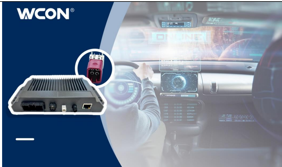
图 3-12 汽车高速连接器应用于智能座舱