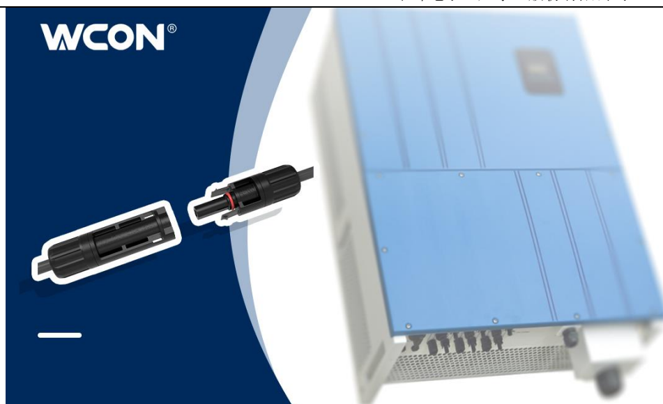
图 3-14 新能源连接器应用于逆变器