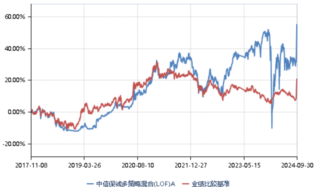
中信保诚多策略混合(LOF)C