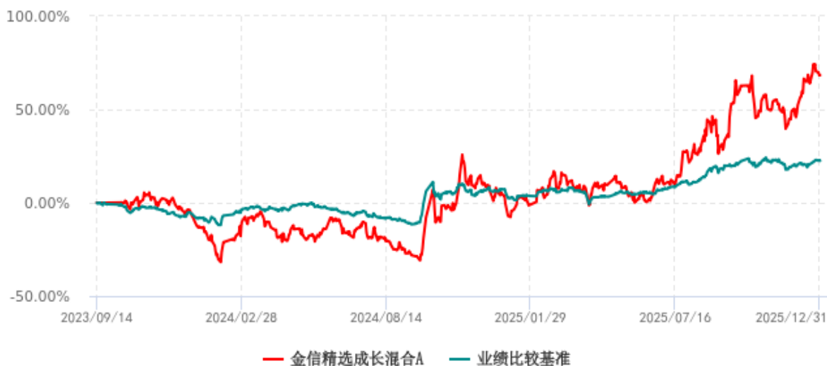
金信精选成长混合A累计净值增长率与业绩比较基准收益率历史走势对比图 (2023年09月14日-2025年12月31日)