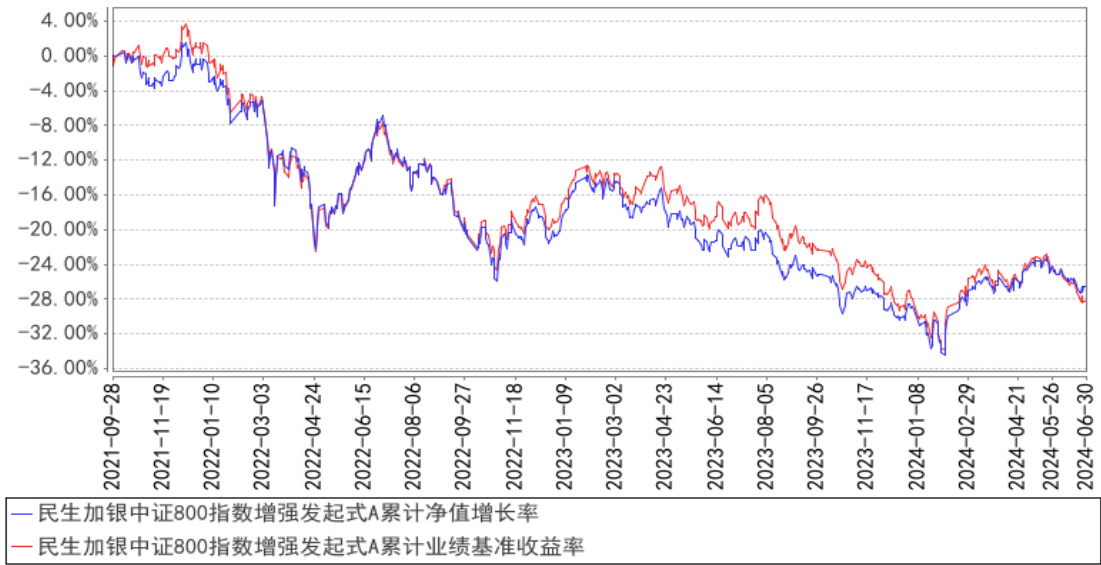
民生加银中证800指数增强发起式A累计净值增长率与同期业绩比较基准收益率的历史走势对比图

注：业绩比较基准=中证 800 指数收益率×95%+银行活期存款利率（税后）×5%