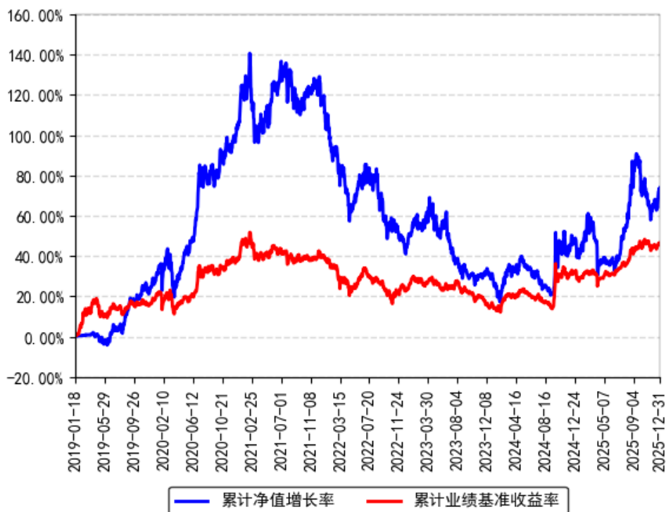
南方益和灵活配置混合累计净值增长率与同期业绩比较基准收益率的历史走势对比图