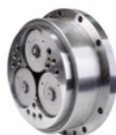
高精度摆线减速机