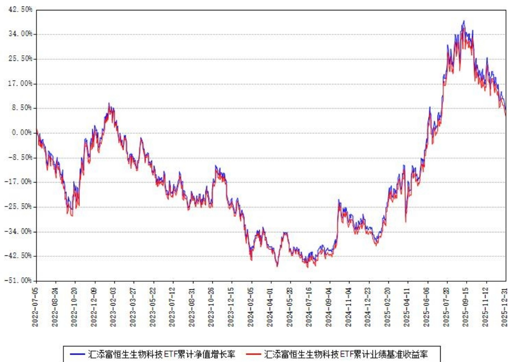
汇添富恒生生物科技ETF累计净值增长率与同期业绩基准收益率对比图

注：本基金建仓期为本《基金合同》生效之日（2022年07月05日）起6个月，建仓期结束时各项资产配置比例符合合同约定。