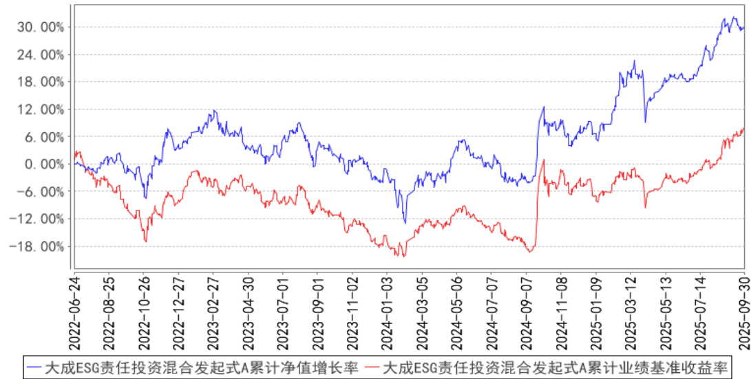
大成ESG责任投资混合发起式A累计净值增长率与同期业绩比较基准收益率的历史走势对比图