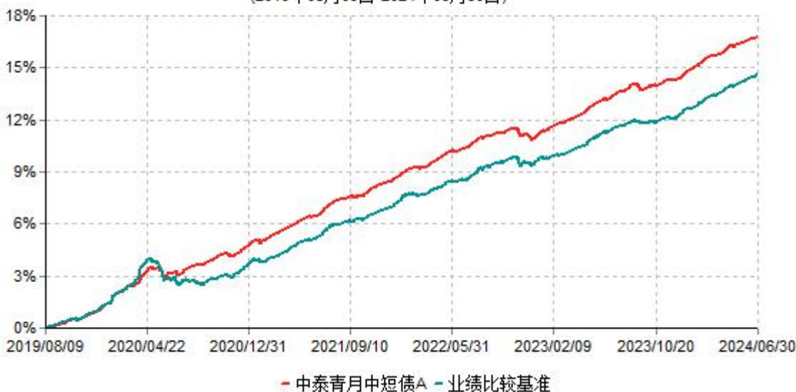
中泰青月中短债A累计净值增长率与业绩比较基准收益率历史走势对比图 (2019年08月09日-2024年06月30日)