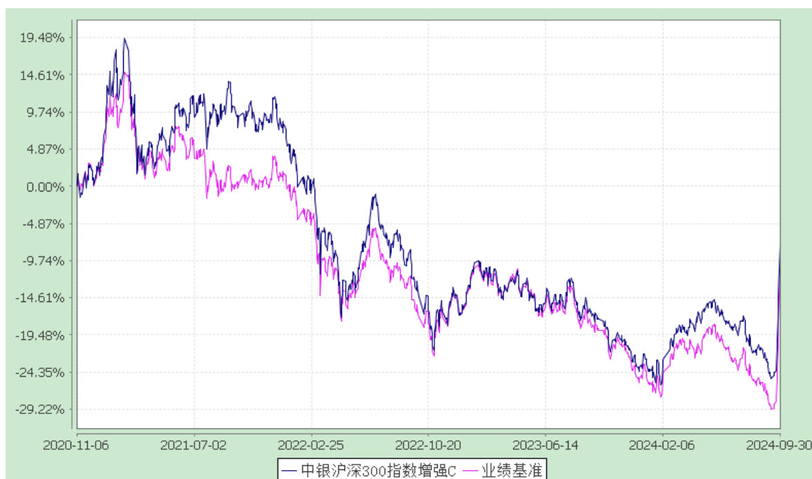
3. 中银沪深 300 指数增强 E: