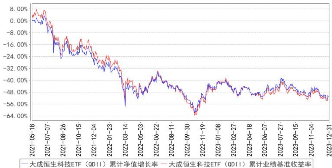
大成恒生科技ETF（QDII）累计净值增长率与同期业绩比较基准收益率的历史走势对比图

注：本基金合同规定，基金管理人应当自基金合同生效之日起六个月内使基金的投资组合比例符合基金合同的约定。建仓期结束时，本基金的投资组合比例符合基金合同的约定。