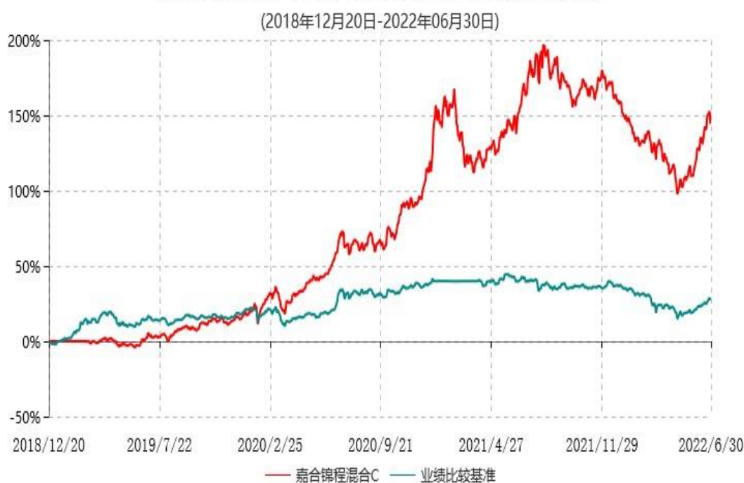
嘉合锦程混合C累计净值增长率与业绩比较基准收益率历史走势对比图